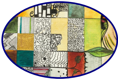
Struktur - Rahmen geben