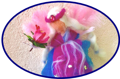
Tagtraum - Märchen