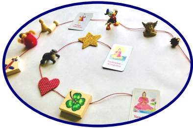
Der rote Faden im Leben - Biographiearbeit